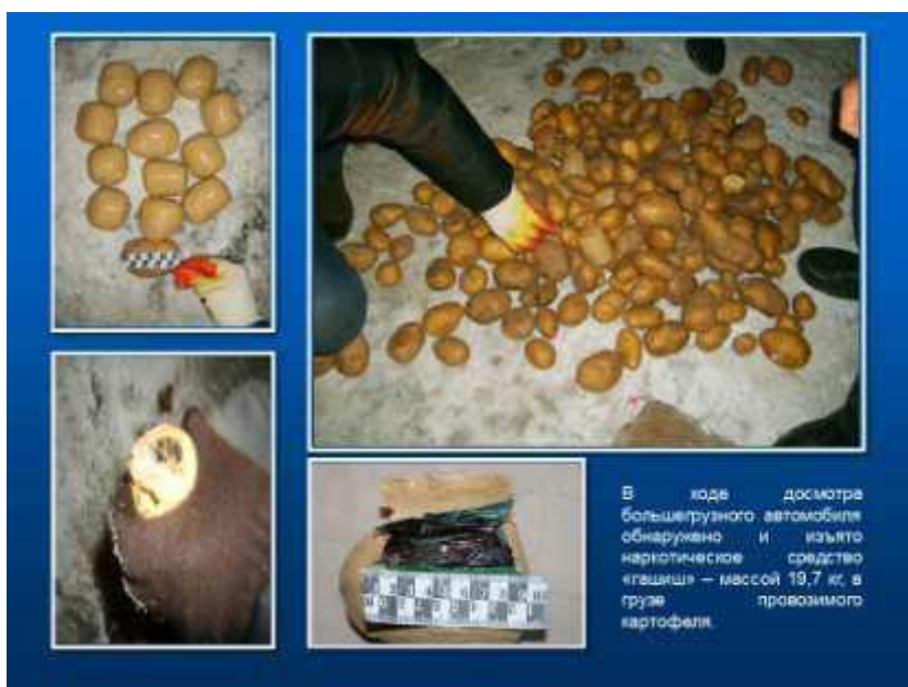
В ходе досмотра большегрузного автомобиля обнаружено и изъято наркотическое средство «гашиш» – массой 19,7 кг, в грузе перевозимого картофеля.